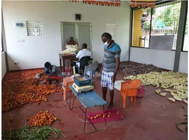
රූප සටහන 1 : ආහාර ද්රව්ය වර්ගීකරණය කරමින්

ශ්‍රී විසුද්ධාවාස බෞද්ධ මධ්‍යස්ථානය, නාගරික ජනගහනයෙන් 4000 ක් සහ පවුල් 1200 කට ආසන්න සංඛ්‍යාවක් සඳහා පහසුකම් සපයමින් මත්තෙගොඩ, කිරිගම්පමුණුව, පොල්ගස්ඔව්ට ප්රදේශයේ පිහිටා ඇත. අධ්‍යාපනය, නිවාස පහසුකම් හා ජීවන තත්ත්වය අනුව මෙහි ප්රජාව සමාජ ආර්ථික වශයෙන් විවිධත්වයක් පෙන්වීය. ප්රජාවෙන් බහුතරයක් බෞද්ධ වූ අතර, කතෝලික/ ක්රිස්තියානි ධර්මය වැළඳගත් පවුල් කිහිපයක්ද ජීවත් වූහ. මෙම ප්රජාවේ පුද්ගලයින් රජයේ හා පෞද්ගලික යන අංශ දෙකෙහිම රැකියාවල නිරත වූ අතර, සමහරුන් ස්වයං රැකියා වල ද, අනෙක් පුද්ගලයන් දෛනික වැටුප් ලබා ගන්නා රැකියා වල ද නිරත වූහ. මෙම ප්රදේශයේ කුඹුරු කිහිපයක් හා ගෙවතු වගා ඇතුළු කුඩා වගා බිම් ද දක්නට ලැබිණ.