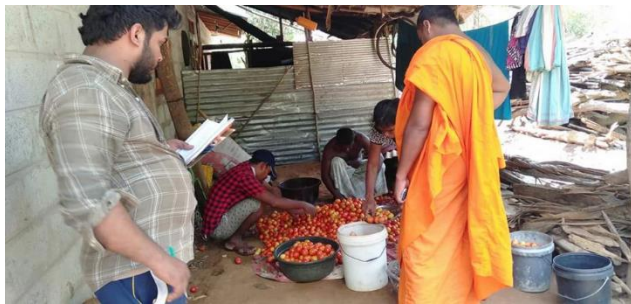
රූපසටහන 2 : එලවලු වර්ගකිරීම අධීක්ෂණය කරමින්

මේ අතර ස්වාමීන් වහන්සේ ඇතුළු කණ්ඩායමට අභියෝග කිහිපයකට ද මුහුණ දීමට සිදු විය. ආරම්භයේ සිටම තරුණ පිරිස් මේ සඳහා ධනාත්මක හා සහයෝගාත්මක ආකල්පයක් දැරුව ද , වැඩිහිටි ජර්ජාවේ ඇතැම් පුද්ගලයන් මෙම කර්තව්‍යය දෙස සැකමුසු කෝණයකින් බැලූහ. “අනිවාර්යයෙන් ම මේ ස්වාමීන් වහන්සේට ඊළඟ ඡන්දයට ඉදිරිපත් වීමේ බලාපොරොත්තුවක් ඇති. නැත්නම්, දුප්පත් මිනිස්සුන්ට කෑම ළඟට ගිහින් දීමේ උවමනාවක් නැහැ, ඔවුන්ට තනිවම තමන්ව බලා ගන්න පුළුවන්නේ!”, ආදී ලෙස ස්වාමීන් වහන්සේට ද ඇතැම් සාකච්ඡා කණවැකි තිබේ.