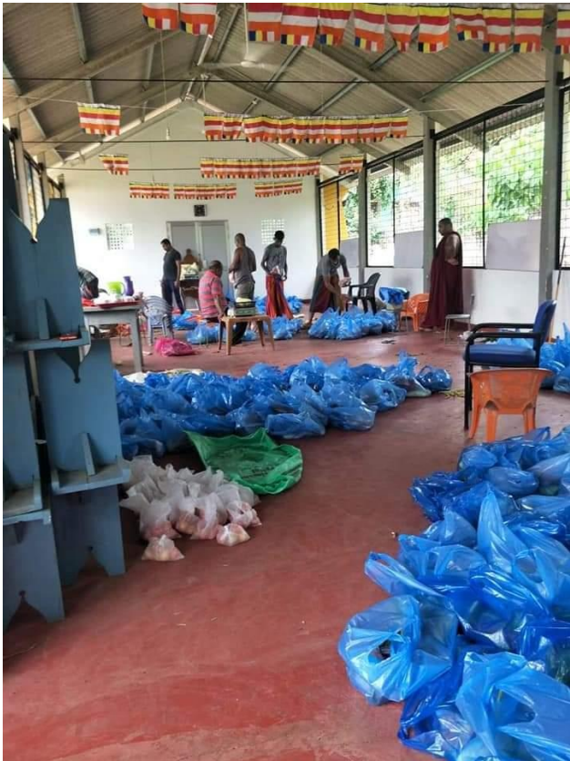
රූපසටහන 2 : බෙදා දීමට සූදානම් කරන ලද එළවළු මළු

රූප සටහන 3 ට අනුව, පළමු වටයේ දී හදිසි අවශ්‍යතා සහිත අඩු ආදායම්ලාභී පවුල් සඳහා ප්‍රමුඛතාවය ලබා දෙන ලදී. දෙවන වටයේ දී, අඩු ආදායම්ලාභී පවුල්වල සෙසු අයට සහාය විය. එමෙන්ම, තුන්වන වටයේදී සංවරණ සීමා හා සැපයුම හිඟ බැවින් ආහාර ද්රවය ලබා ගැනීමට අපහසු මධ්යම ආදායම් ලබන පවුල් වලට ද ආහාර පාර්සල් බෙදා දීමට උත්වහන්සේට හැකිවිය.